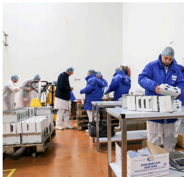
Les jeunes travailleurs autistes, au poste de panachage