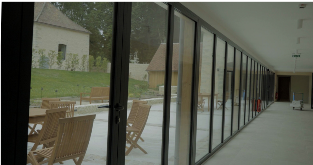
La Maison du Parc possède un jardin aromatique dédié aux activités de l'après-midi

L'ancien corps de ferme entièrement rénové et mis aux normes grâce au financement du groupe Andros comprend deux bâtiments, l'un réservé aux locaux de service et aux salles d'activités communes, l'autre est dédié aux lieux de vie privés et collectifs. Une cour intérieure dessert les différents espaces.