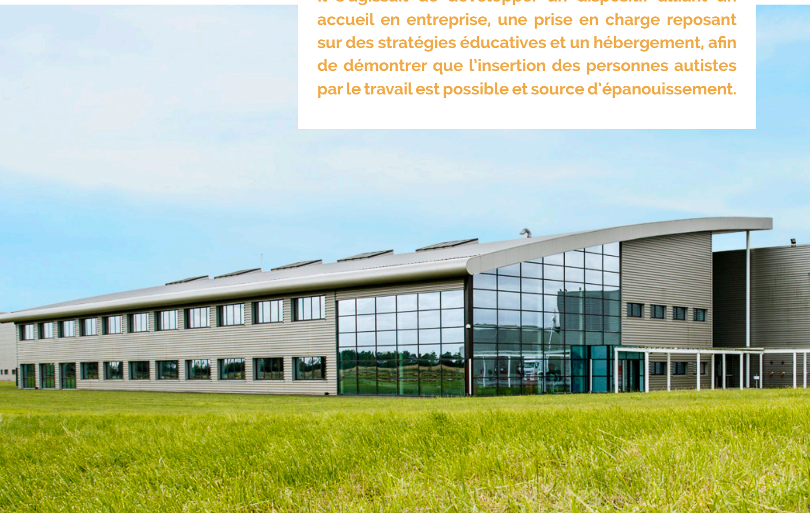
Novandie, filiale du groupe Andros, localisée à Auneau (28), est spécialisée dans le secteur d'activité de la fabrication de produits laitiers ultra frais : yaourt, fromage frais et desserts.

Il s'agissait de développer un dispositif alliant un accueil en entreprise, une prise en charge reposant sur des stratégies éducatives et un hébergement, afin de démontrer que l'insertion des personnes autistes par le travail est possible et source d'épanouissement.